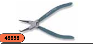
Щипцы для стопорных колец (сжим загнутый), 9" AG010006