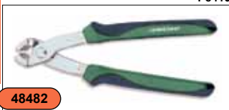
Клещи 10" CR-MO, скрытая пружина P8410