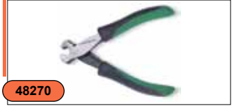
Кусачки торцевые (мини) P7102