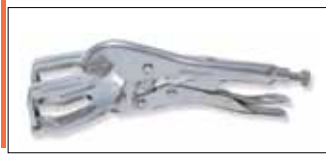
Ручные сварочные тиски струбцина