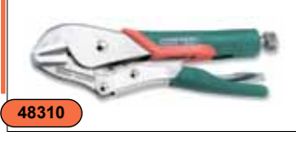
Ручные тиски струбцина 10", с обрезиненными рукоятками P30M10C