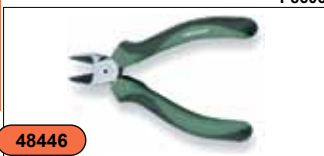
Бокорезы 6" CR-MO, скрытая пружина P8606