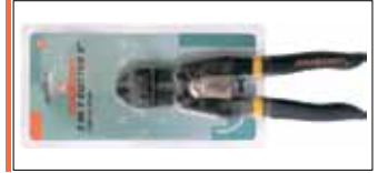
Кусачки для шурупов, проволоки и кабеля «3 в 1»