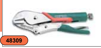
Ручные тиски струбцина 7", с обрезиненными рукоятками P30M07C