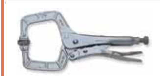
Ручные тиски струбцина глубокого захвата