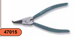
Щипцы для стопорных колец (разжим загнутый), 7" AG010011