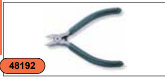
Бокорезы 4" P5602