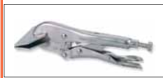
Ручные тиски струбцина для листового железа