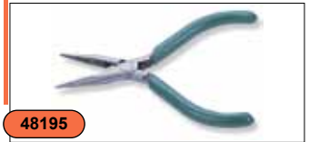
Тонкогубцы 5" P5605