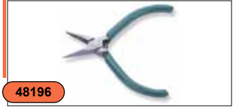
Длинногубцы 4,5" P5606