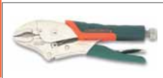
Изогнутые ручные тиски струбцина с кусачками для проволоки