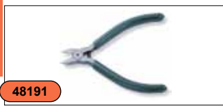
Бокорезы 4,5" P5601