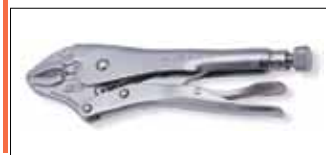
Изогнутые ручные тиски струбцина с кусачками для проволоки