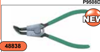
Щипцы для стопорных колец с удлиненными губками (разжим загнутый), 216 мм P9508D