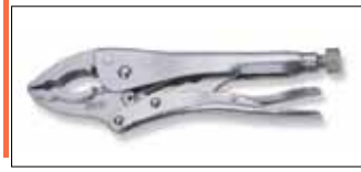
Ручные тиски струбцина с зажимом