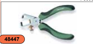
Щипцы 6", для зачистки проводов P8806