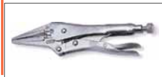
Ручные тиски струбцина с удлиненными прямыми губками