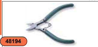
Бокорезы 5" P5604