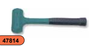
Молоток резиновый, без отдачи, 0,52 кг M11045