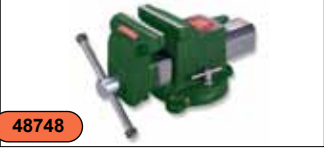
Тиски слесарные 8" (сталь) C-A12