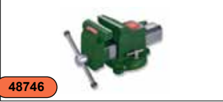
Тиски слесарные 4" (сталь) C-A8