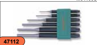
Набор выколоток, 6 предметов M64106S