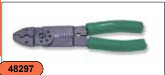
Профессиональный инструмент для обжима и зачистки проводов V1403