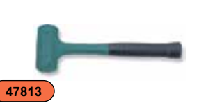
Молоток резиновый, без отдачи, 0,43 кг M11035