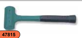
Молоток резиновый, без отдачи, 1,05 кг M11055