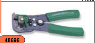
Профессиональный инструмент для обжима и зачистки проводов усиленный V1502