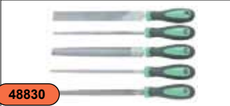
Набор напильников, 5 предметов MF05S