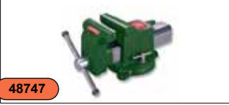
Тиски слесарные 6" (сталь) C-A11