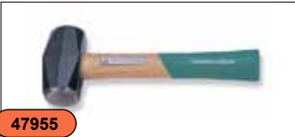
Кувалда с деревянной ручкой, 1,8 кг M21040