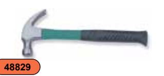
Молоток столярный 750 г M05016