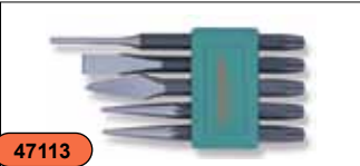
Набор зубил и кернов, 5 предметов M64105S