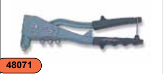
Заклепочник упрочненный 2,4-4,8 мм, 4 насадки V1001