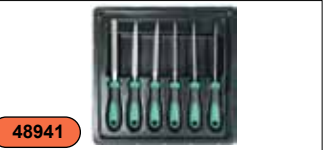
Набор надфилей 100 мм, 6 предметов MFM06S