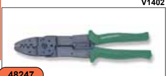
Профессиональный инструмент для обжима и зачистки проводов V1402