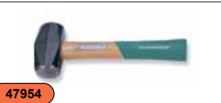
Кувалда с деревянной ручкой, 1,36 кг M21030