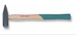
Молоток инженерный (DIN стандарт)