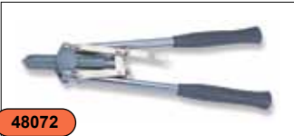
Заклепочник рычажный 3,2-6,4 мм V1003