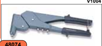
Заклепочник с поворотной головкой (360°) 2,4-4,8 мм V1004