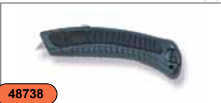
Нож с выдвижным сменным лезвием (в комплекте два лезвия) MK2040