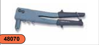
Заклепочник 2,4-4,8 мм V1000