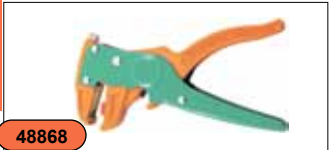
Щипцы для резки и зачистки проводов V1505