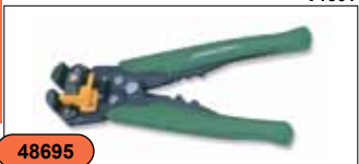
Профессиональный инструмент для обжима и зачистки проводов усиленный V1501