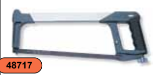
Ножовка Deluxe, с 12" HSS полотном (P6M5) MHS100AG