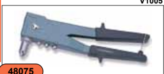
Заклепочник двусторонний профессиональный 2,4-4,8 мм V1005