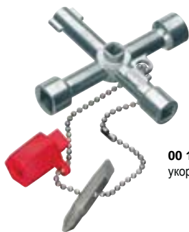
00 11 02 укороченная конструкция, длина - 44 мм