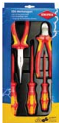
00 20 13