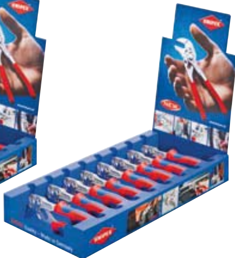
00 19 12 V02