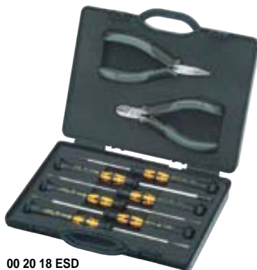
00 20 18 ESD