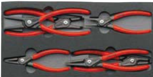
00 20 01 V02