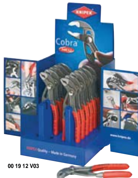
00 19 12 V03