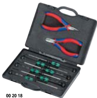
00 20 18