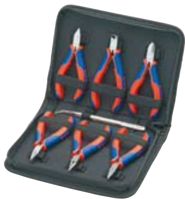
00 20 16