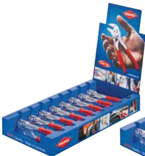
00 19 12 V01