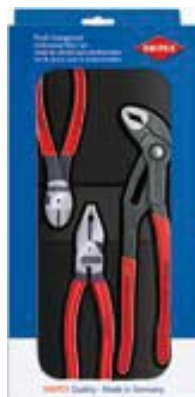
00 20 10