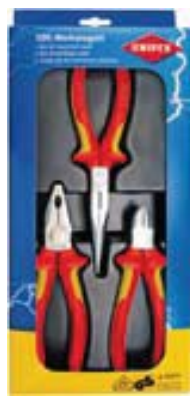
00 20 12