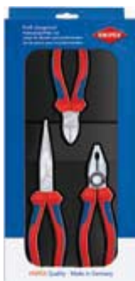
00 20 11