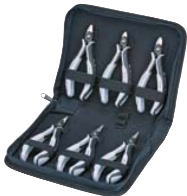
00 20 16 P ESD