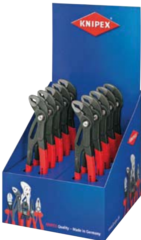
00 19 19 V02