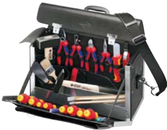
00 21 02 SL