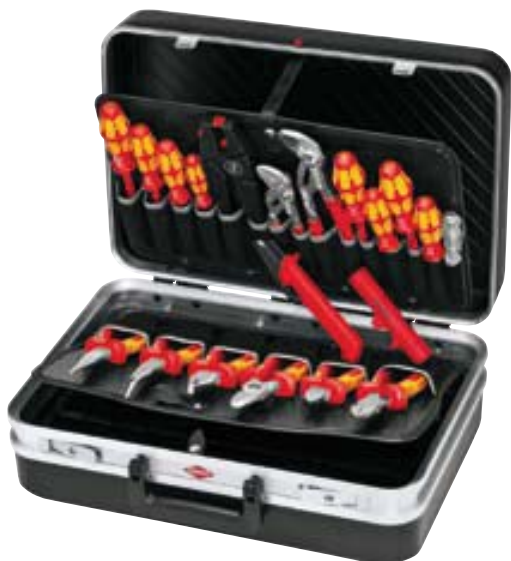
00 21 20