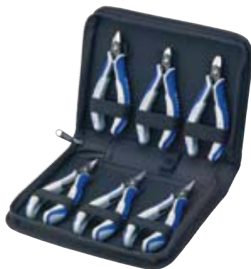
00 20 16 P