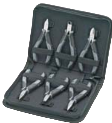
00 20 17