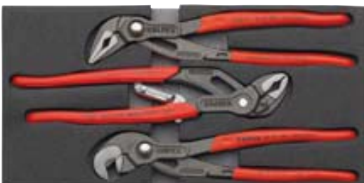
00 20 01 V03