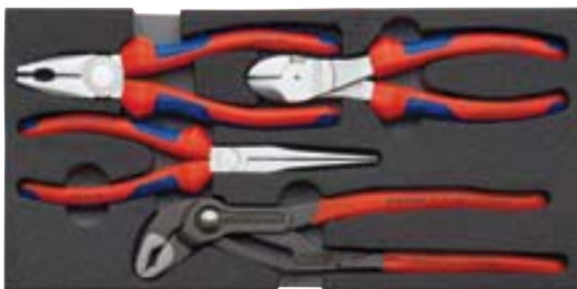
00 20 01 V01